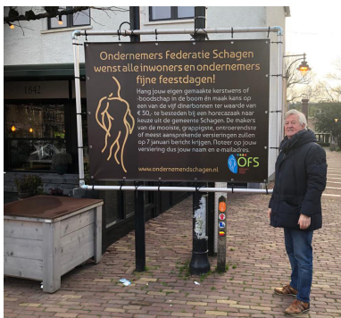
Decemberactie op de Markt in Schagen t.b.v. Horeca gemeente Schagen

door Corona. De sector heeft besloten om in 2020 garant te staan voor de kosten voor de Toeristische informatiegids , i.v.m. mogelijk door Corona tegenvallende inkomsten door advertentieverkoop. De OFS heeft de totale kosten voorgeschoten. De inkomsten door middel van de advertentieverkoop zijn terug te vinden bij de post inkomsten door OFS georganiseerde projecten in het financieel jaarverslag (inkomsten informatiegids € 17.400). Daarnaast is er een bijdrage beschikbaar gesteld voor het opmaken van een promotiefilm voor Callantsoog en Grote Keeten. Deze film wordt als promotie voor de kust van onze gemeente ingezet als onderdeel van incallantsoog.nl. Op verzoek van de ondernemers zijn deze gelden uitsluitend ingezet voor digitale lokale promotie van ons gebied. Dit is in gang gezet met Druktemaker uit Den Helder.