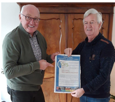
Wees loyaal en koop lokaal