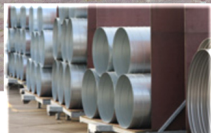
Industrie & Bedrijven