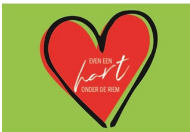
Hart onder de riem – kaart