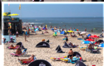
Recreatie & Toerisme