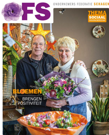
OFS Magazine - edities 26 t/m 29