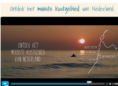
Film, promotie kustgebied

Er is overleg geweest met enkele ondernemersverenigingen over een mogelijk gezamenlijk te organiseren ondernemersbijeenkomst, waarbij een gerenommeerde spreker uitgenodigd zal worden om een actueel en interessant onderwerp te behandelen, met als doel de ondernemers te bereiken, betrekken en inspireren. Dit zal, zodra de omstandigheden het weer toelaten, opgepakt worden.