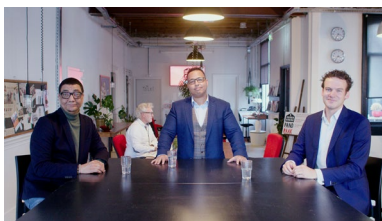
Podcast Wij in de Polder