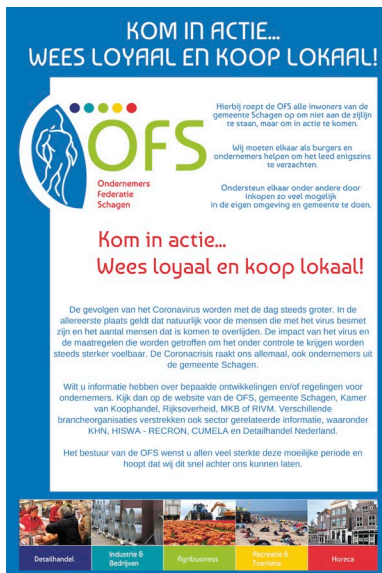
Wees loyaal en koop lokaal