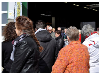
Lanceringsbijeenkomst "Wij rijden hier met én voor u"

provincie. Onderwerpen die aan de orde zijn gesteld zijn o.a. de oost-west verbinding binnen de gemeente, Ontwerp-Omgevingsvisie NH2050 en de zorgen van de OFS over de beperkte woningbouw mogelijkheden en de daarmee samenhangende werkgelegenheid. Het is belangrijk de statenleden kennis te laten maken met het gebied en hen te informeren over problematieken die spelen in de Kop van Noord-Holland en in de gemeente Schagen.