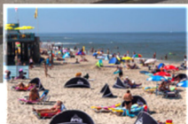
Recreatie & Toerisme