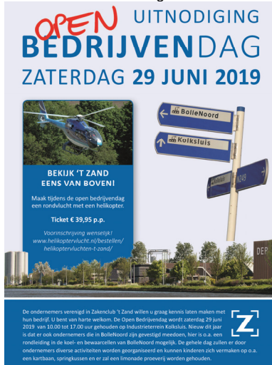
Open Bedrijven dag in 't Zand