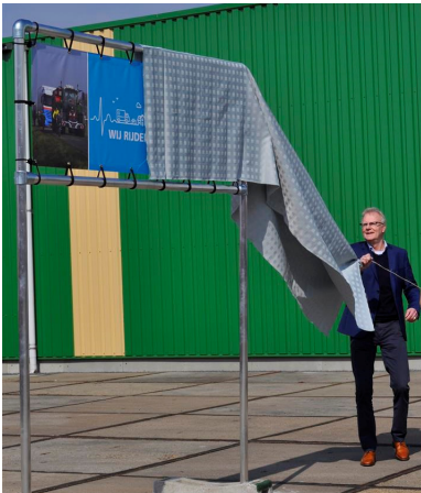
Start "Wij rijden hier met én voor u"