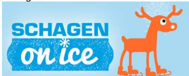
Schagen on Ice

Schager Uitdaging; Congres TopNH; Bijeenkomst Statenleden Warmenhuizen; HALLO2017; Bijeenkomst VNO NCW (Arbeidsomstandighedenwet); Congres Geluk; Bijeenkomst Regionale winkelstructuurvisie; Bijeenkomst Burgerbrug (extra vaste oeververbinding); Waterrecreatie; Industrierrein Lagedijk; Bijeenkomst Regionale detailhandelsvisie; Verkeersambities gemeente Schagen; Makado.