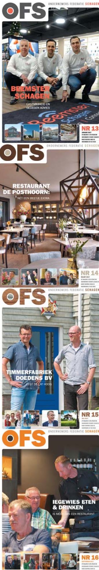
OFS Magazine - edities 13 t/m 16