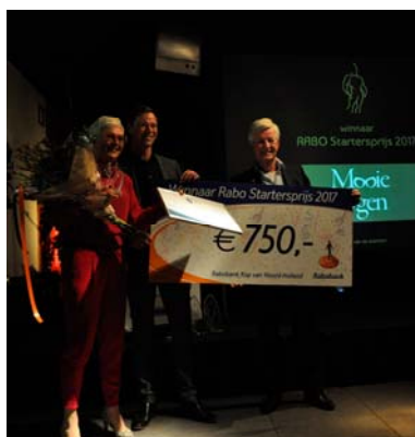
Winnaar Rabo Startersprijs

De bestuursleden van de OFS hebben in 2017 regelmatig bijeenkomsten bijgewoond omtrent specifieke onderwerpen. Hier wordt door de OFS veel waarde aan gehecht. Tijdens deze bijeenkomsten worden de bestuursleden gevoed met informatie over belangrijke en actuele onderwerpen en daarnaast is het van belang om in contact te treden met ondernemers, overheidsinstanties en overige partijen. Enkele bijgewoonde bijeenkomsten zijn o.a.: Bijeenkomsten omtrent glasvezel ; Maatschappelijke Beurs van de