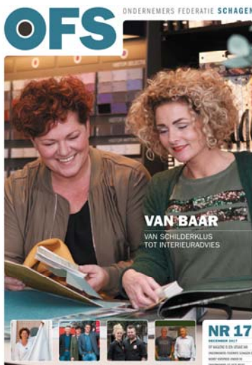
OFS Magazine - editie 17

Via de website kunnen ondernemers uit de gemeente Schagen informatie vinden over relevante ondernemersonderwerpen, over de OFS en over bijeenkomsten van de OFS. De website is een medium waarmee alle ondernemers uit de gemeente Schagen geïnformeerd kunnen worden. Tevens plaatst de OFS voor ondernemers belangrijke nieuwsberichten over bijvoorbeeld wegwerkzaamheden- en afsluitingen, nieuwe wet en regelgeving, actuele ontwikkelingen en subsidiemogelijkheden voor ondernemers.