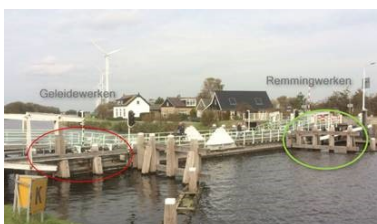
Infrastructuur - vlotbruggen (oost-west)