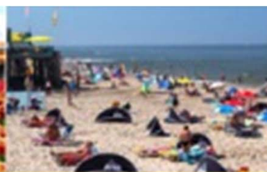
Recreatie & Toerisme