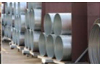
Industrie & Bedrijven