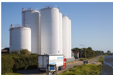
Sector Industrie & Bedrijven