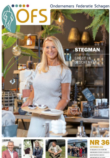
OFS Magazine - editie 36 (sept.)