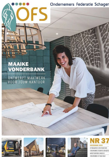
OFS Magazine - editie 37 (dec.)