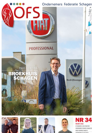
OFS Magazine - editie 34 (maart)