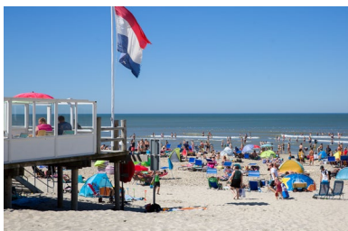
Sector Recreatie & Toerisme